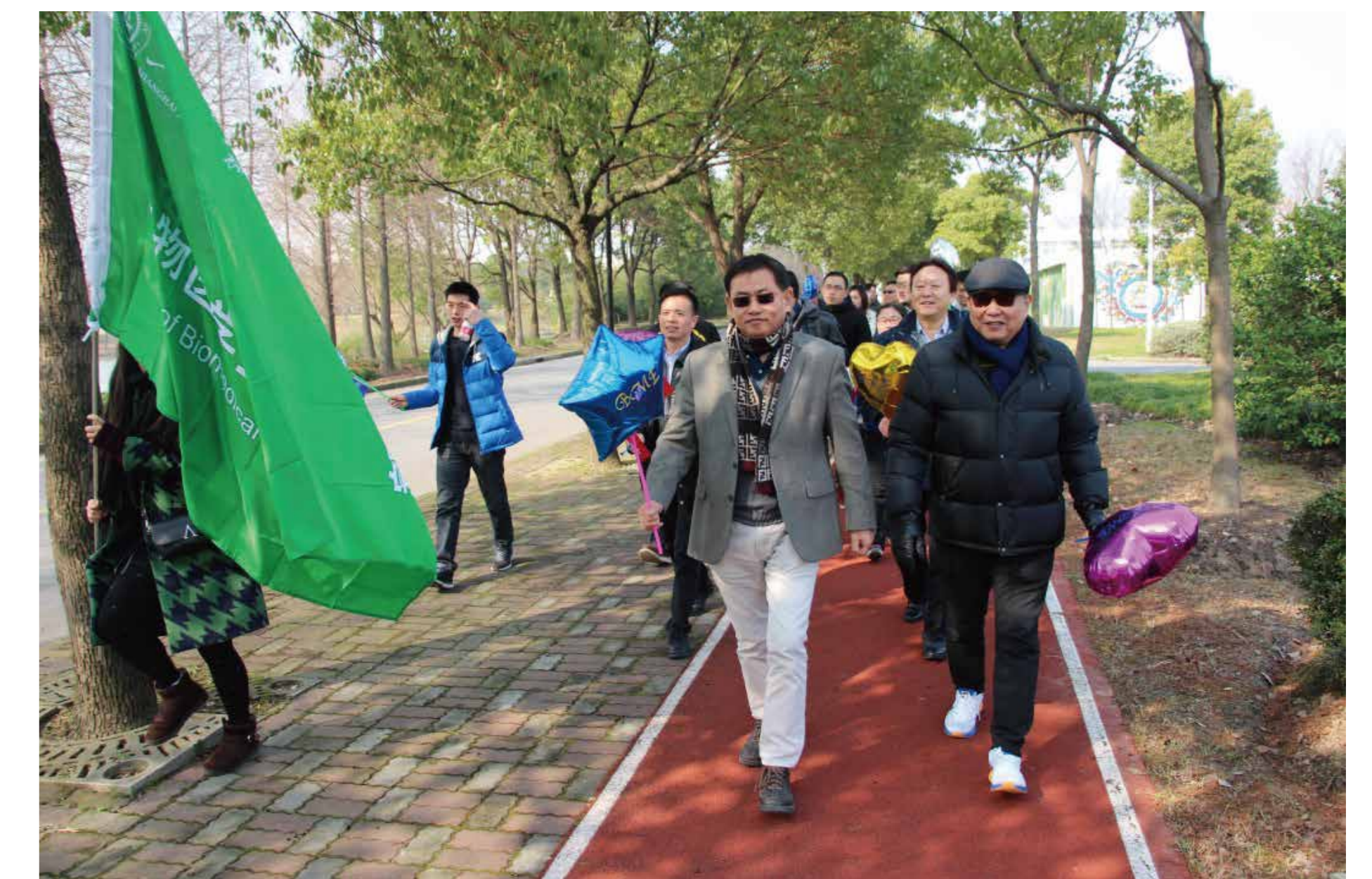
生物医学工程学院工会举行“喜庆党的十九大”和“迎接党的十九大”校园健步走活动